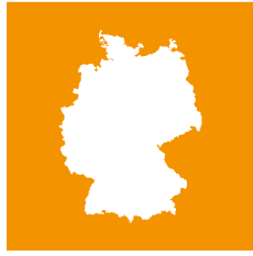
Deutschland -weites Programm